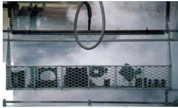
少ロット生産の技術が大量生産に生きる。

同社では、タフカラー30と呼ばれる着色硬質アルマイト処理で、鮮やかな色彩と、製品の強度、および品質向上を図っている。タフカラー30は、三和メッキ工業独自の特許製品である。 また、北陸地方最大の4,400mmの槽を備えて、大型化する半導体設