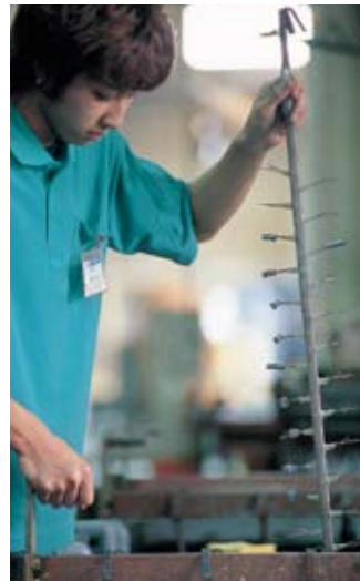
技術の伝承。20代のメッキ職人。

このサイトには、自動車、バイク、自転車、ガン・ホビー、インテリアパーツ、装飾品など、多彩な趣味や、思い出の品が寄せられて、お客様からの好評を博している。